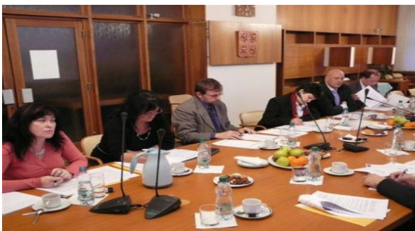
Politici představitelé Rozhodovacího týmu Kulatého stolu na svém druhém setkání

Hlavním tématem setkání politiků specializujících se na oblast zdravotnictví byla diskuse o budoucnosti zdravotnického systému. Zástupci participujících parlamentních stran před jednáním připravili seznam deseti nejdůležitějších bodů, vizí či cílů, kam by měl být zdravotnický systém podle jejich názoru směřován. Pozice neparticipující ČSSD byla získána technikou stínování z jejich dlouhodobého programu. Nad získanými příspěvky proběhla diskuse, kterou shrnul koordinátor projektu Ing. Ondřej Mátl, MPA, MSc.: „Z předběžné analýzy získaných materiálů je možné identifikovat teze, na kterých se jednotlivé strany shodují. Politické strany shodně akcentují, že by měl být zachován systém solidárního veřejného zdravotního pojištění a měla by být zajištěna jeho finanční udržitelnost. Podle politiků je nežádoucí umožnit vyvázání bohatých ze systému veřejného zdravotního pojištění; zdravotní pojištění by mělo zůstat povinné, měl by být stanoven standardní rozsah péče a ten placen z veřejných prostředků. Současně je však třeba zvážit za jakých podmínek by bylo možné míchat soukromé a veřejné zdroje. Kompenzace individuálních rizik by měla být zajištěna formou zachování 100 % přerozdělení mezi zdravotními pojišťovnami. Zdravotnictví by současně mělo být vnímáno jako veřejná služba s řízenou konkurencí.“