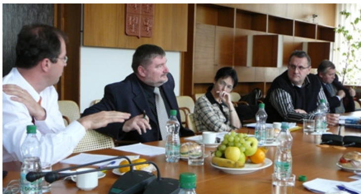
Odborníci Kulatého stolu při diskusi o struktuře spotřeby lůžkové péče